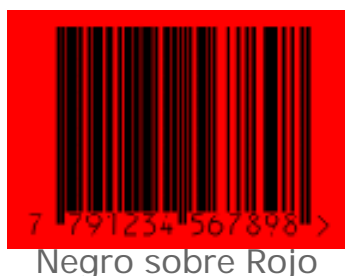
Negro sobre Rojo