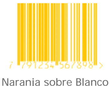
Naranja sobre Blanco