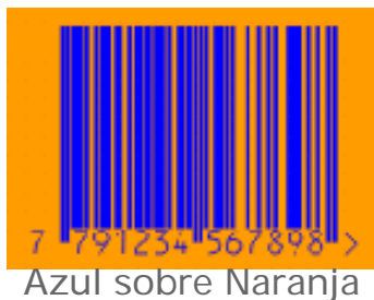
Azul sobre Naranja