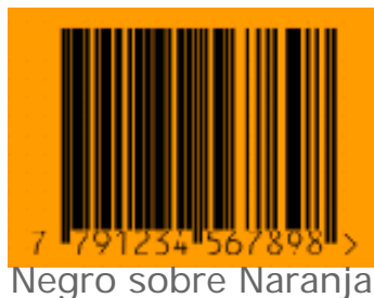
Negro sobre Naranja