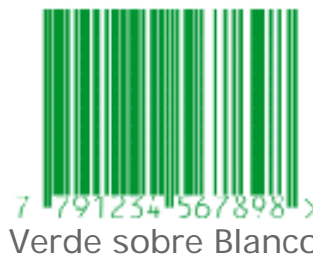
Verde sobre Blanco