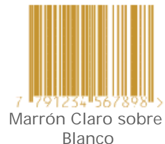
Marrón Claro sobre Blanco