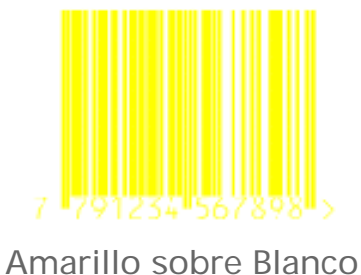
Amarillo sobre Blanco