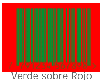
Verde sobre Rojo