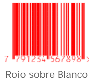
Rojo sobre Blanco