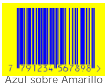
Azul sobre Amarillo