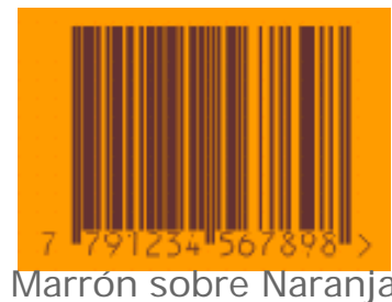
Marrón sobre Naranja