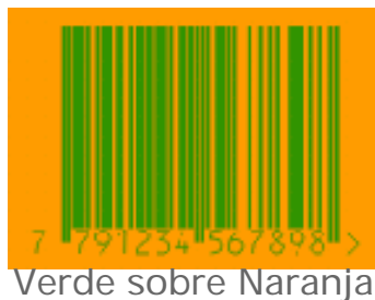
Verde sobre Naranja