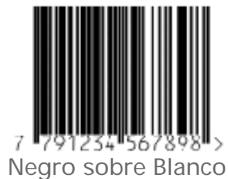
Negro sobre Blanco