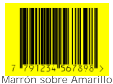
Marrón sobre Amarillo