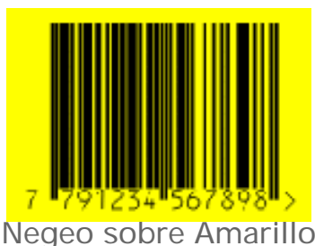
Negeo sobre Amarillo