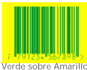
Verde sobre Amarillo