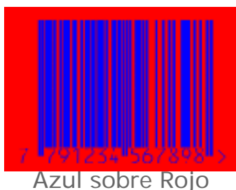
Azul sobre Rojo