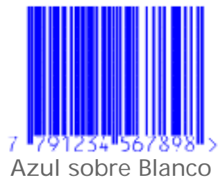
Azul sobre Blanco