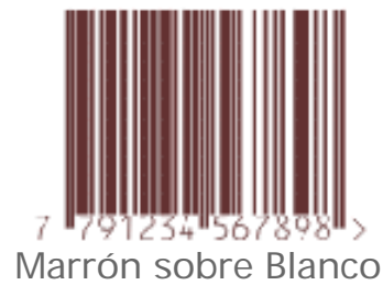
Marrón sobre Blanco